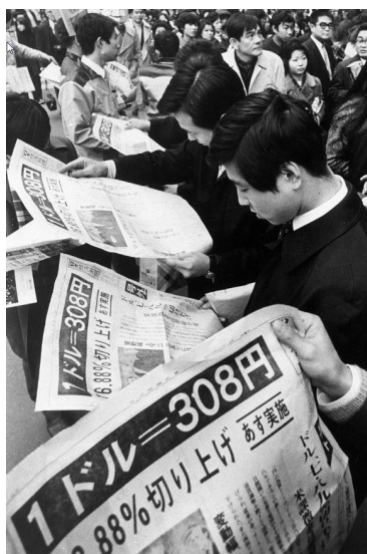
図表2:1971年 スミソニアン協定

団塊の世代が、日本の高度経済成長の前に生まれて中卒、高卒、大卒それぞれの年代で経済成長に貢献する労働力だったことと比較すると、団塊ジュニアは日本の高度成長が終わる頃の世代といえます。