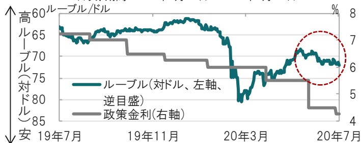
図表2：ロシアルーブルと原油先物価格の推移