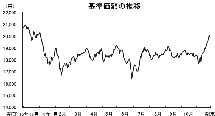
○基準価額の high・安値