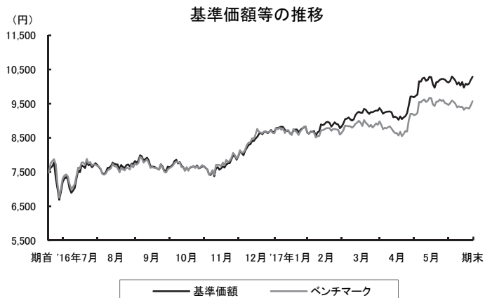
○基準価額の高値・安値