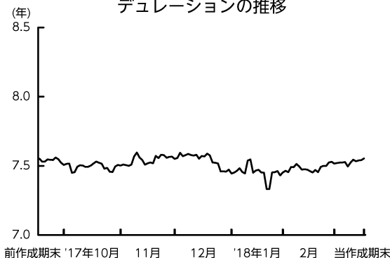
デュレーションの推移

先物取引を利用してデュレーション*の調整を行い、当作成期中は約7.3~7.6年程度としました。