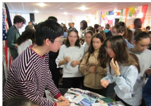
徳島グローバルスタンダード人材育成事業