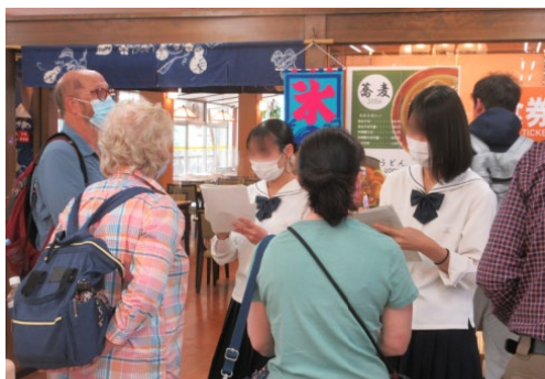
高校生国際プロジェクト支援事業