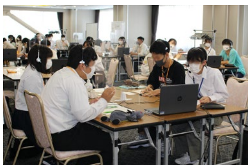
Tokushima世界への扉プロジェクト事業(グローバルキャンプ)