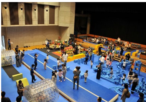
プレイフルパークの様子(木津川市)