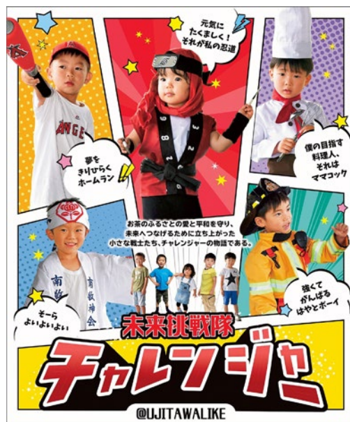
チャレンジャーポスター(宇治田原町)