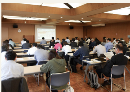
【事業者向け】エコスタッフ養成セミナー