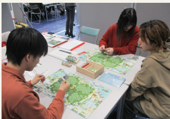
【県民向け】ゼロ・カーボン就活イベント2025