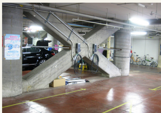
【県有施設脱炭素化】県庁舎EV充電器設置