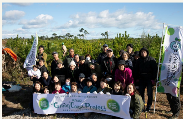
R6海岸防災林バスツアー