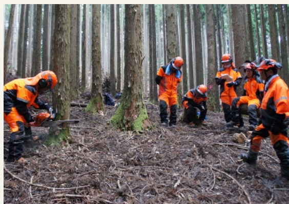
演習林での伐倒実習【兵庫県立森林大学校】