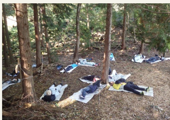
森林セラピー体験【兵庫県立森林大学校】