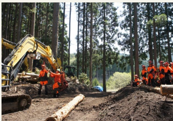
林業機械実習【兵庫県立森林大学校】