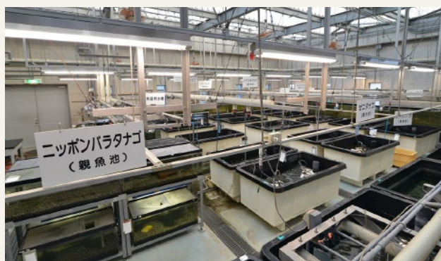
保護増殖センター