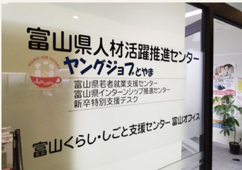
新卒特別支援デスク